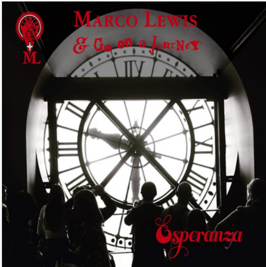
"Esperanza" Indie Folk - Jazz Projet de fin d'étude - 2019