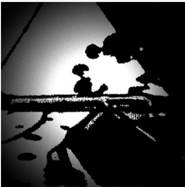
"ABC" - 2020