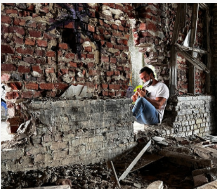
"The daily outdoor session" (5 songs) - Fall 2022