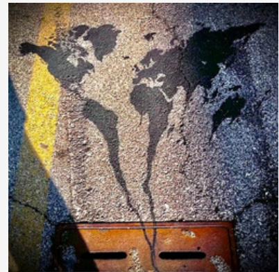
"Brooklyn's Wall" - 2021